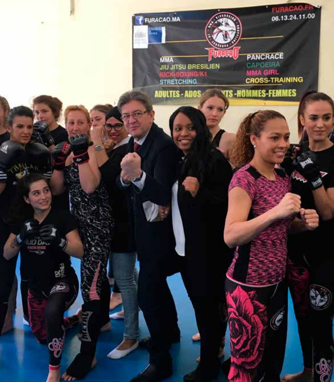
Jean-Luc Mélenchon au club de boxe Furacao, Marseille